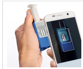
5. Оцените результаты теста