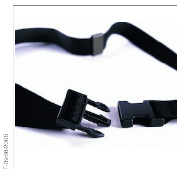
Поясной ремень для Dräger Saver