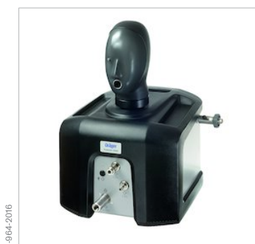
Dräger Quaestor 5000

Все статические и динамические испытания в Dräger Quaestor 5000 выполняются полуавтоматически, как оптимизированная последовательность ручных и автоматических этапов. Современное программное обеспечение поддерживает пользователя интуитивно понятными инструкциями.