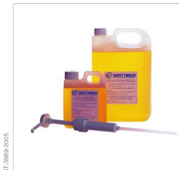
Жидкость для очистки Safety Wash